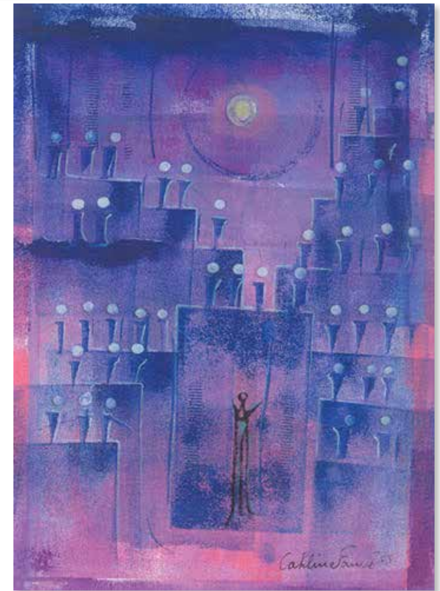
© Les p'tites lumières de la vie - encre