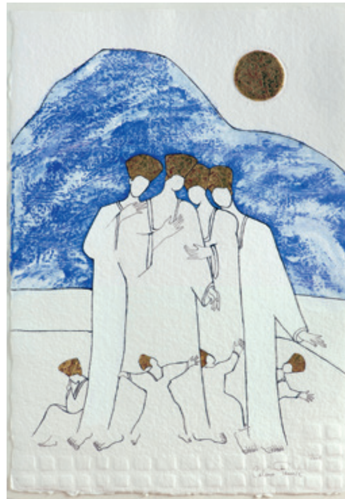
© Instant de Vie - encre - acryl - gaufrage - feuille d'Or

Il y a des œuvres d'art, qui n'ont d'artistique que le nom. Qui laissent dans la plus imperturbable des indifférences. Puis il y a des toiles, qui bien plus de simples objets de décoration dont on s'enorgueillit en bonne compagnie, deviennent de véritables miroirs pour nos sentiments les plus secrets. CE tableau, celui qui pousse à la réflexion, invite à la déconnexion, chamboule divinement nos émotions. Celui qui, né de l'esprit furieusement créatif et inspiré de Cahline Fauve, vient littéralement bousculer notre vision d'un Art autrefois considéré comme passif et sans reflets.