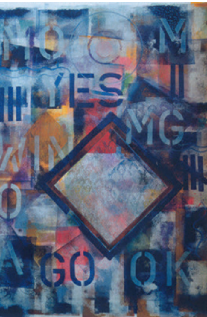
© Paysage de ville - encre

www.cahlinefauve.ch cahline.fauve@bluewin.ch +41 (0) 32 721 14 22