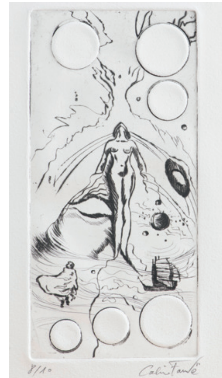
© Le voyage - gravure sur cuivre - eau forte - gaufrage.