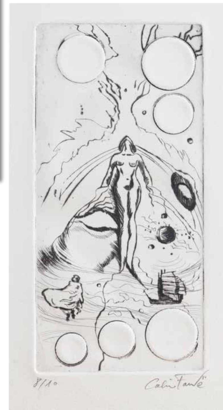
©Le voyage - gravure sur cuivre, eau forte, gaufrage