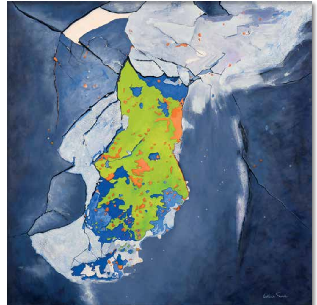
©Le baiser de la terre - huile 100x100 cm