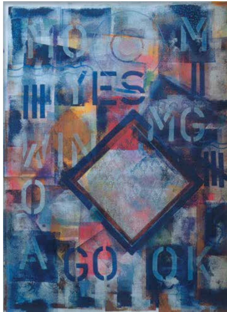
©Paysage de ville - encre