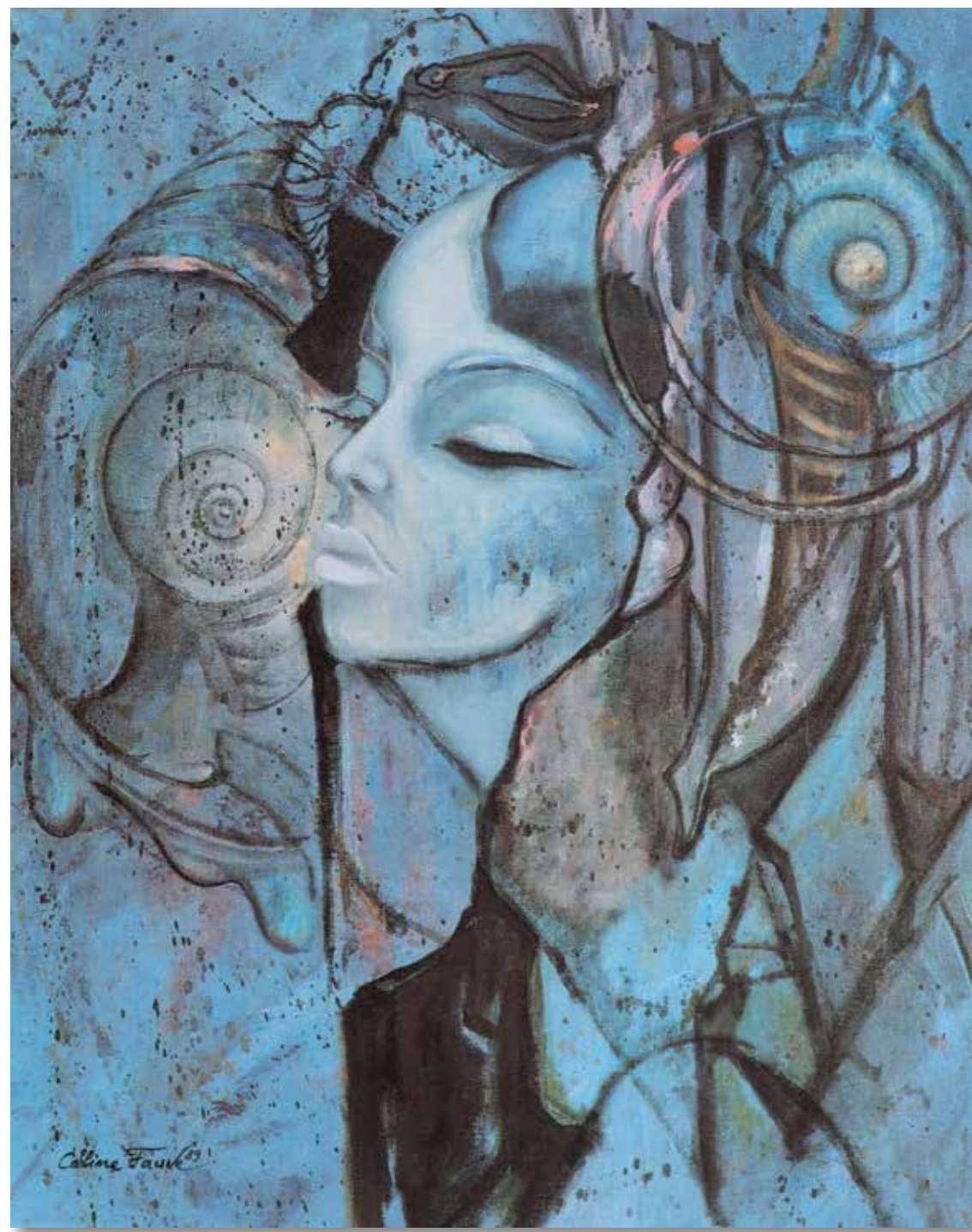
©Femme indigo - huile