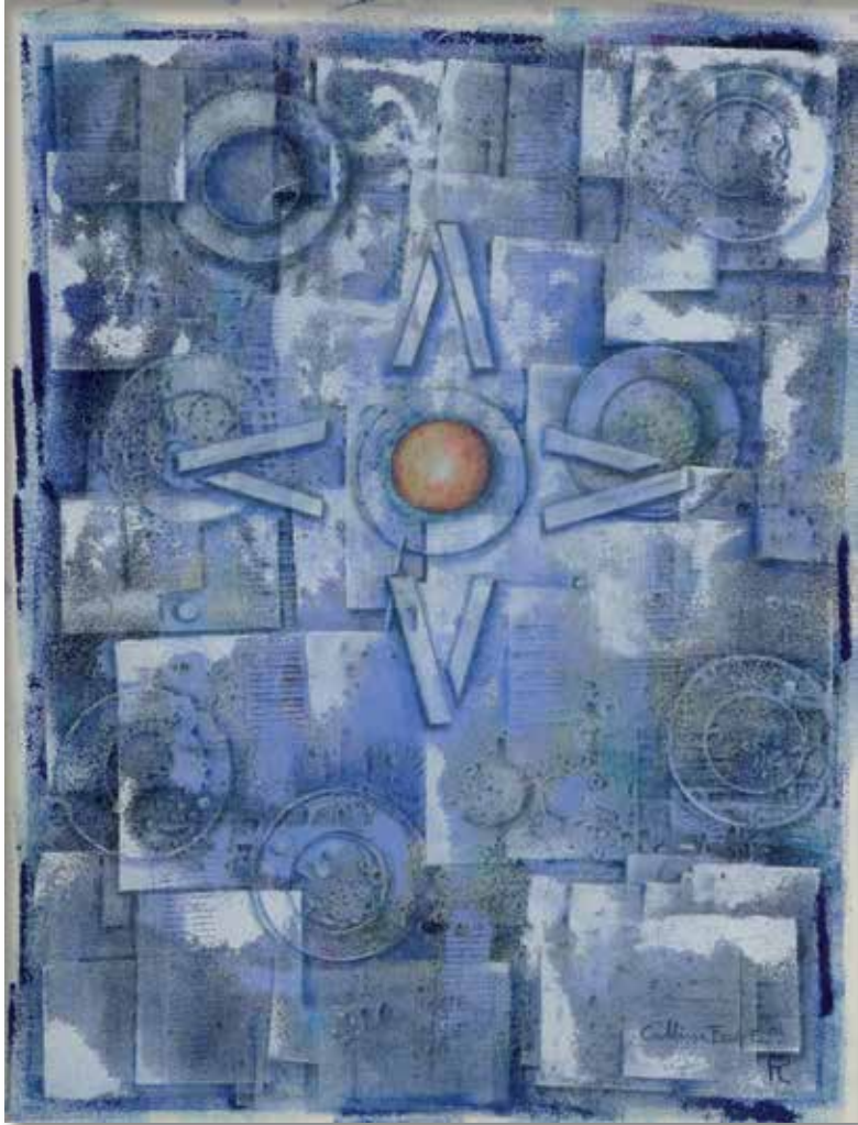
encre