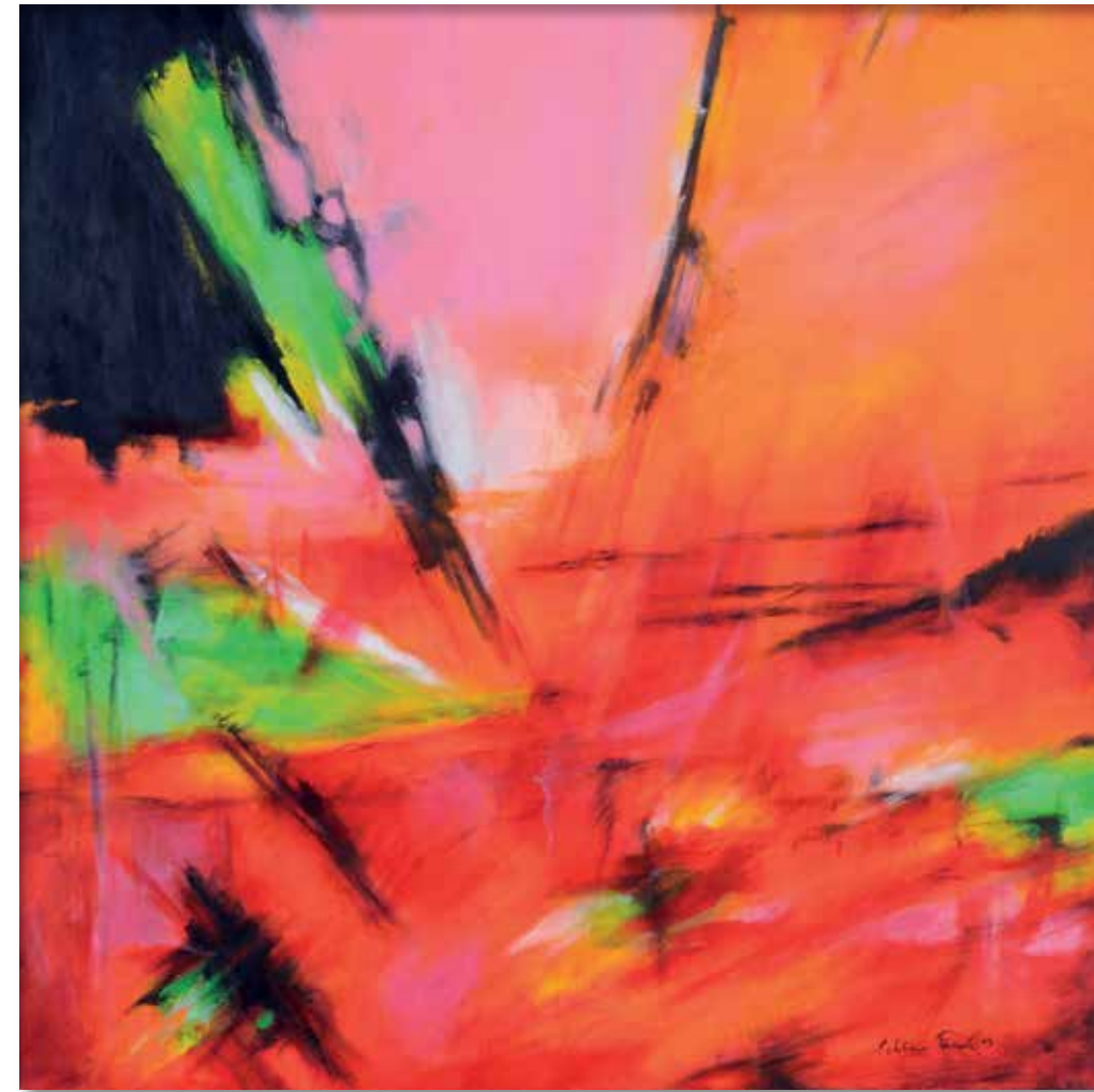
©Jaillissement lumineux - acryl 80x80 cm